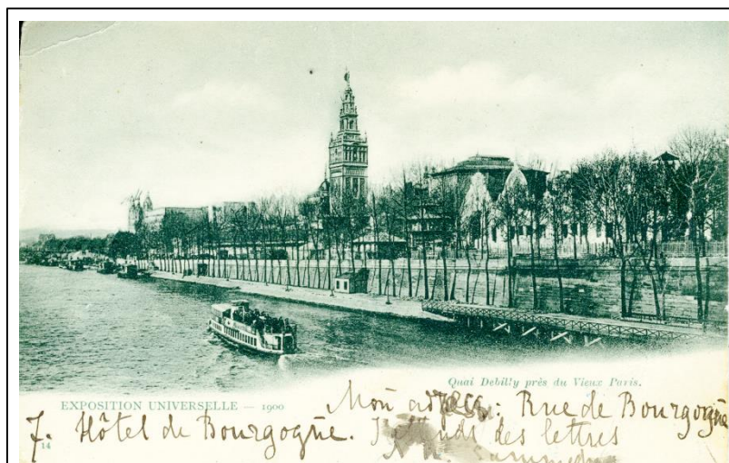
Exposition universale – 1900 Quai Debilly près du Vieux Paris (Набережная Дебилли возле старого Парижа – фр.)

Открытое письмо с ч/б фото, внизу надписи: