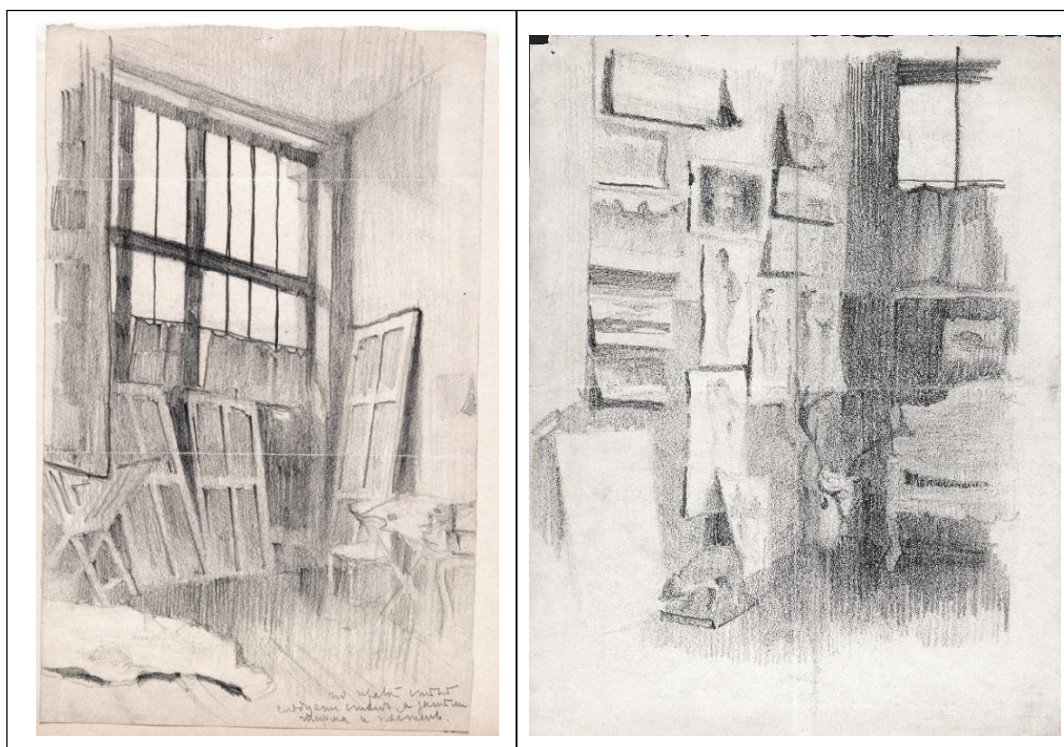
Н.К. Рерих. Мастерская художника. (2 рис.) [1900 г. Париж.]

Публикуется по изданию: Рерих Н.К.. «Письма к В.В. Стасову. Письма В.В. Стасова Н.К. Рериху» СПб. 1993.